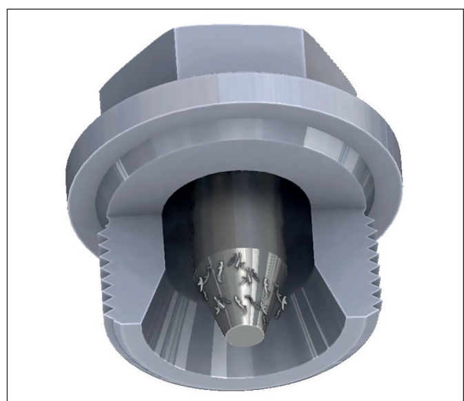
Abb. 2 Späne sammeln sich im Trichter